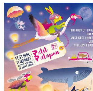
Sous le même toit