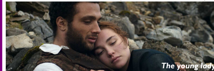
The young lady