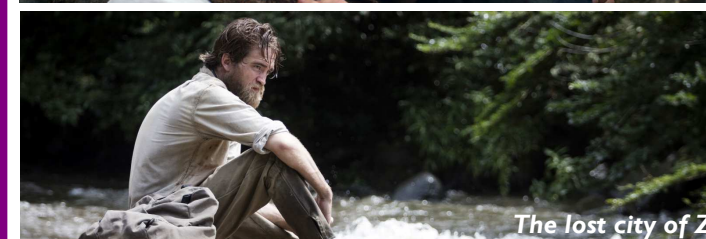
The lost city of Z